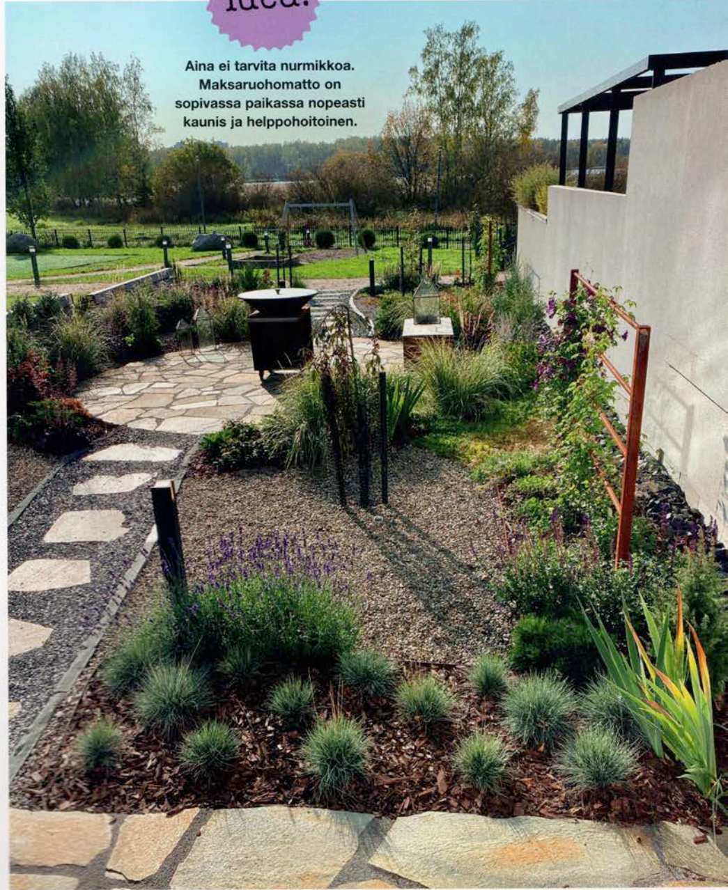
Upea Paljakan pronssi -liuskekivi ja ruosteinen Corten -teräs sopivat hyvin yhteen merensinisten kasvien kanssa. Laventelit kasvavat varsinaisten istutusalueiden ulkopuolella.